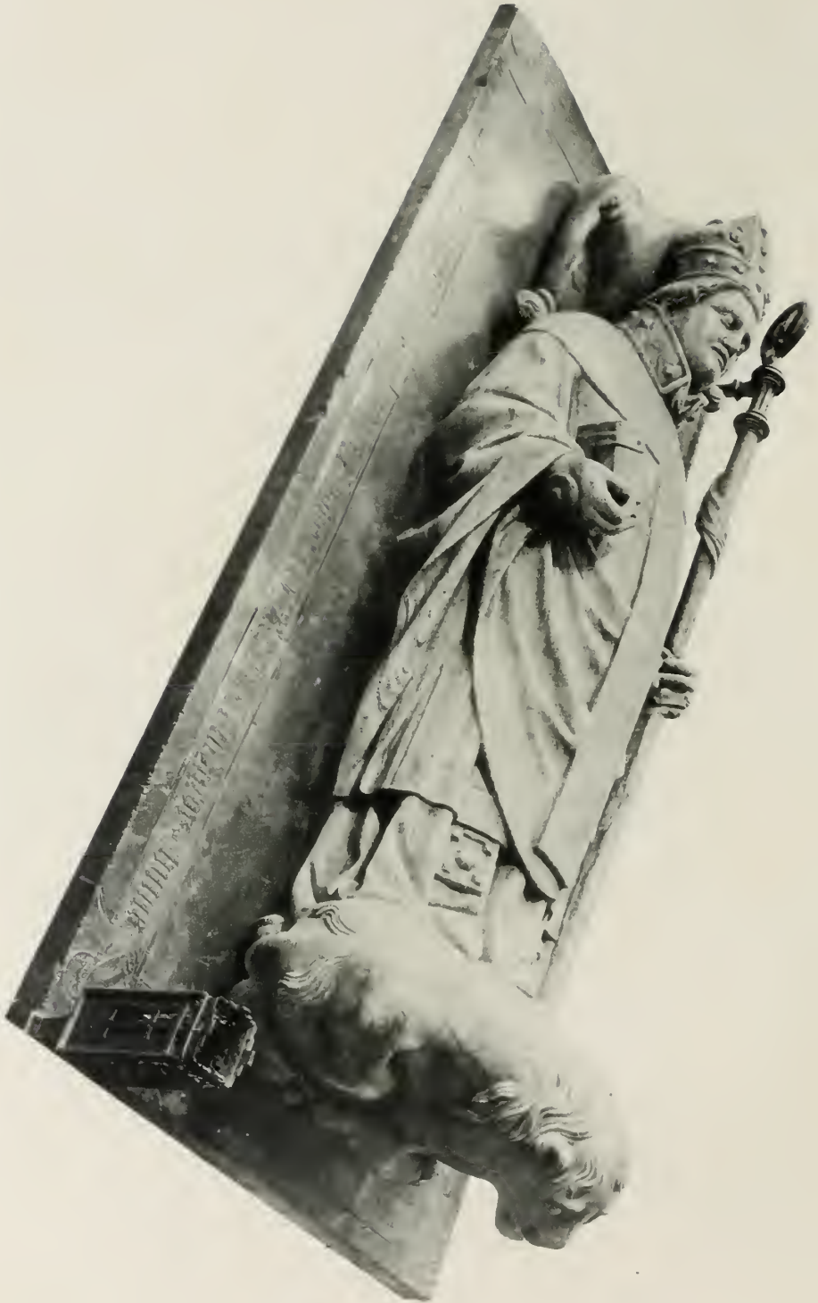
Přezláv von Pogarell. (Tafel 2)